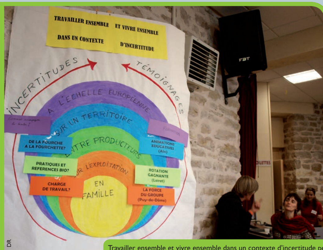
Travailler ensemble et vivre ensemble dans un contexte d'incertitude peut se décliner à plusieurs échelles

Au-delà de la sphère qui concerne directement le couple et la famille, les conjoint(e)s interviennent le plus souvent dans le processus de prise de décisions et dans le choix des grandes orientations. Dans le contexte de l'agriculture familiale, les vies professionnelle et familiale sont très souvent imbriquées, même si de plus en plus de conjoint(e)s travaillent à l'extérieur. Certaines formations proposées par les AFOGC s'adressent d'ailleurs à des couples mais aussi à toutes les personnes concernées par la ferme car le ou la chef d'exploitation n'est pas le seul maître à bord.